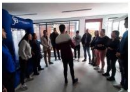
Ilustración 18. ocupacional Cabina del autocuidado y bienestar Ingeplan.co