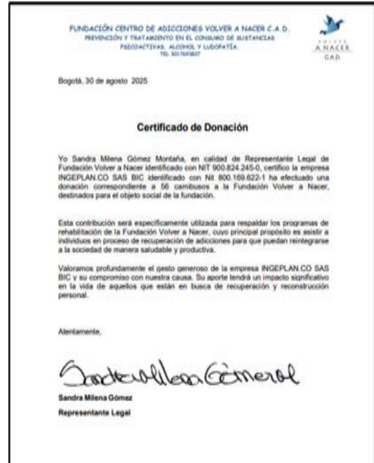
Ilustración 7. Certificado de donación – Fundación Centro de adicciones Volver a Nacer