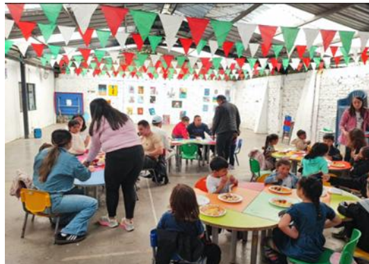
Ilustración 4. Voluntariado corporativo con Fundación Mariana Novoa