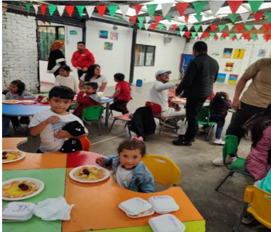
Ilustración 2. Voluntariado corporativo con Fundación Mariana Novoa