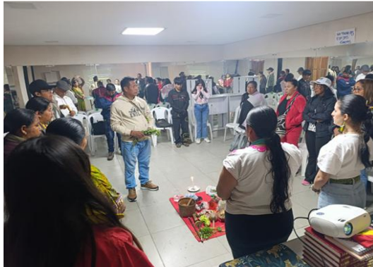
Ilustración 21. Talleres participativos con comunidad indígena – Candelaria Étnico