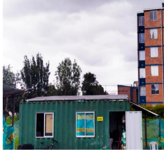
Ilustración 13. Paneles solares instalados en container – Proyecto renovación canal Américas