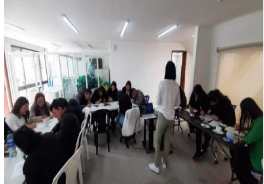
Ilustración 16. Actividad de mindfulness y salud mental – Ingeplan.co