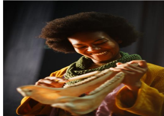
Ilustración 22. Encuentro intercultural con comunidad raizal – Usaquén Étnico