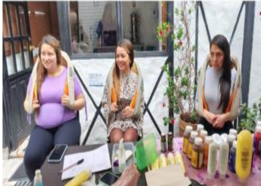
Ilustración 15. Jornada de masajes y bienestar laboral – Ingeplan.co