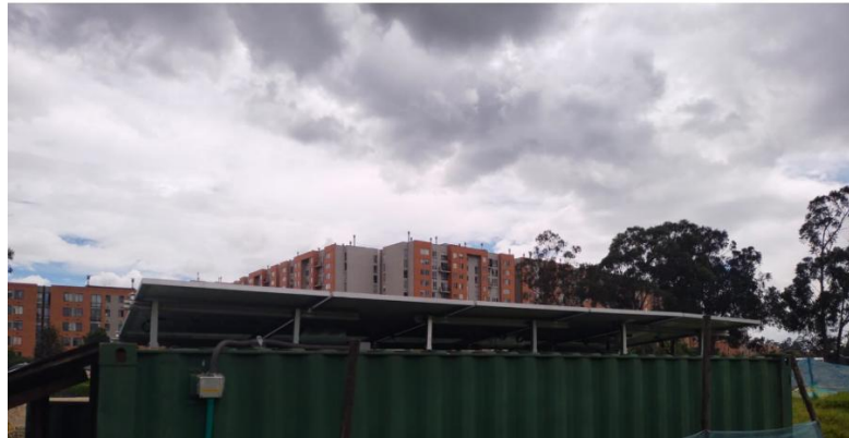
Ilustración 14. Cubierta del container con sistema de paneles solares – Proyecto renovación canal Américas