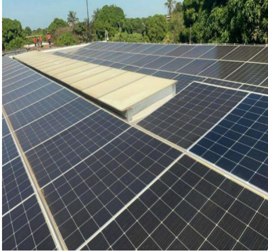
Ilustración 12. Paneles solares instalados en container – Proyecto renovación canal Américas