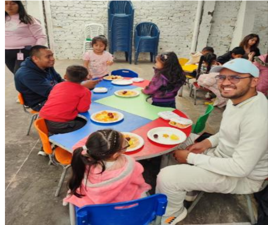
Ilustración 3. Voluntariado corporativo con Fundación Mariana Novoa