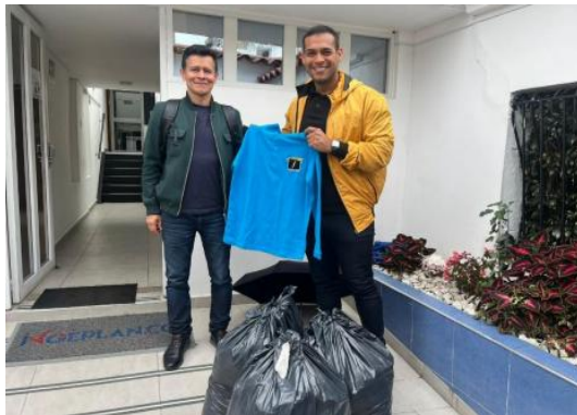
Ilustración 10. Entrega de ayudas y aportes solidarios - Fundación Centro de adicciones Volver a Nacer