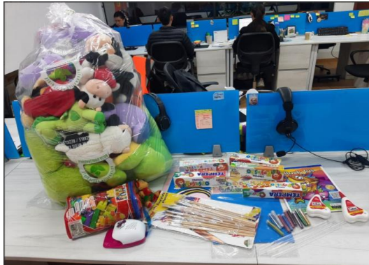
Ilustración 6. Donación de juguetes y material didáctico – Fundación Mariana Novoa