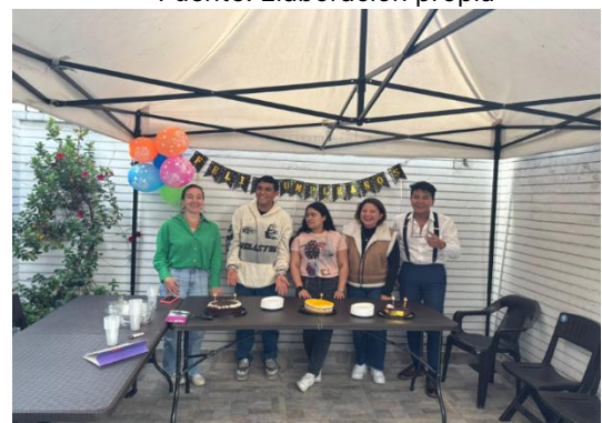
Ilustración 20. Integración y celebración de cumpleaños – Ingeplan.co