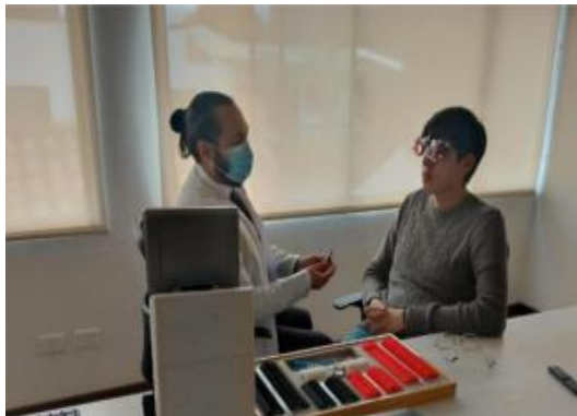
Ilustración 17. Tamizaje visual – Ingeplan.co