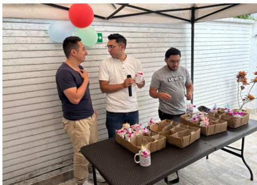
Ilustración 19. Celebración del Día de la Mujer – Ingeplan.co